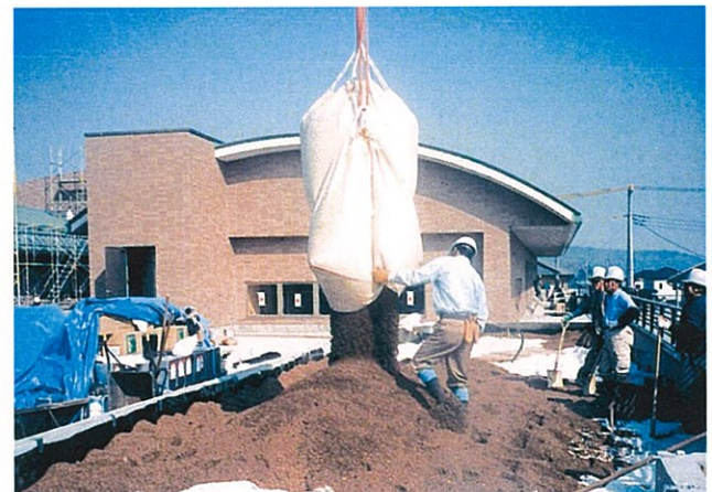
ホワイトローム4F充填、透水フィルター設置後、軽量人工土壌ピバソイル敷均