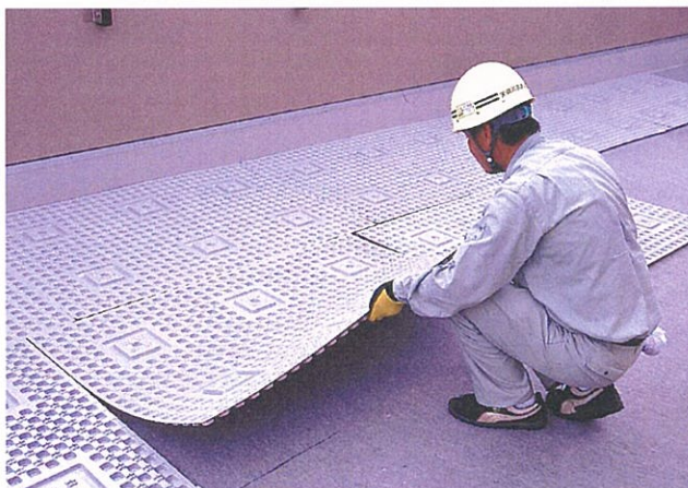
耐根補助シート・保護マット敷設後、αウェーブを設置