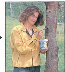
傷口を鋭利な刃物で処理する。 人工樹皮 ラックバルサン)を塗る